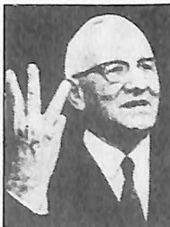
聖霊と異言の賜物(一)