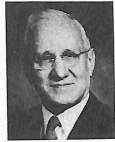
スタンレー ジョーンズ コーナー